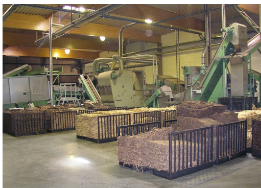
Les feuilles passent à travers la machine dans le bon sens grâce à un convoyeur avec mécanisme d'orientation