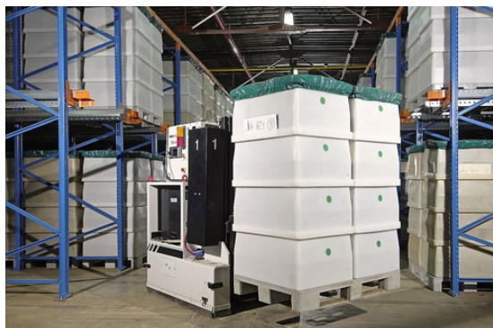
Aujourd'hui, l'ensemble du processus de production est informatisé

de 170 g, idéal pour la tubeuse, un tabac léger à l'arôme généreux);