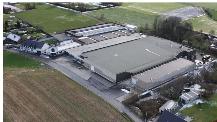
Depuis sa création en 1943, l'entreprise de tabac Stubbe nv a réussi à augmenter sa production annuelle à 2.000 tonnes

Chaque produit nécessitant des processus de production séparés, il est devenu difficile de combiner les trois. J'ai commencé à travailler